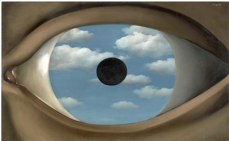
El falso espejo, Magritte