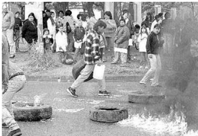
Imagen 2: Piquete de mochilas