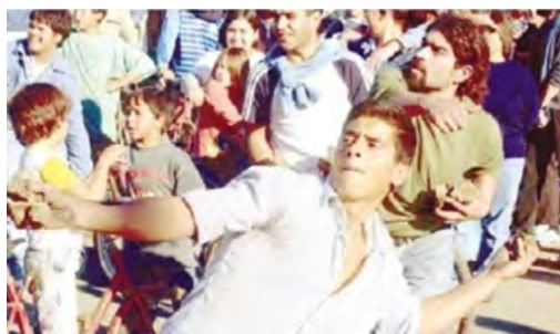
Imagen 1: Joven arrojando una piedra

En primer término, las imágenes fotográficas presentes en las coberturas refuerzan un sentido sobre la condición juvenil: cuando se agrupan conforman colectivos peligrosos. Observemos un caso: