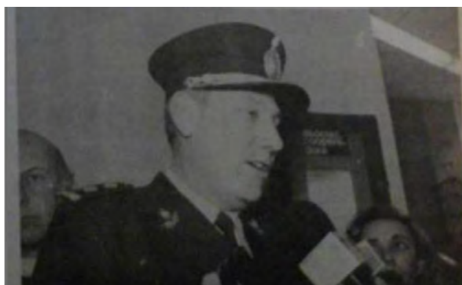
Imagen 3: Fuerzas de seguridad

Un aspecto recurrente de las imágenes fotográficas presentes en las coberturas es la presencia dentro del campo capturado de representantes de fuerzas de seguridad.