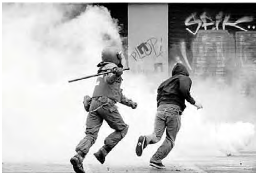
Imagen 4: Fuerzas de seguridad y jóvenes

La materialidad de las imágenes da acceso a un registro sobre el cuerpo y sus manifestaciones; aparecen como un conjunto de indicios al momento de apreciar, evaluar, percibir, clasificar y valorar a una persona. Permiten analizar cómo opera el juicio en tales clasificaciones, y en este sentido el cuerpo es la más irrecusable objetivación, que manifiesta de diversas maneras (Bourdieu, 2014). En la hexis corporal, de forma visible, y por tanto clasificable y valorable, se juegan también las expectativas del otro en relación con la moral y la intelectualidad. Como se mencionó en el apartado anterior, las movilizaciones y resistencias estudiantiles no son algo nuevo, como tampoco lo son sus intentos de represión (Muchembled, 2010). En la siguiente fotografía se resalta la violencia asociada a los jóvenes y se destaca el accionar policial como forma de solución y control.